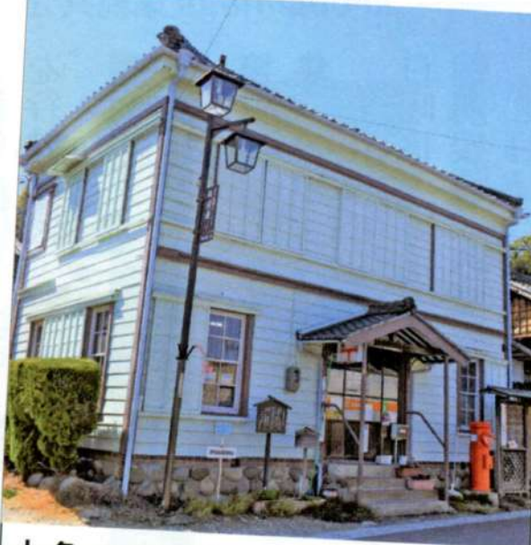
知多岡田簡易郵便局

水色のかわいい郵便局。現存 する日本最古級の郵便局です。 明治にタイムスリップ。